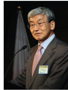
松島会長のご挨拶